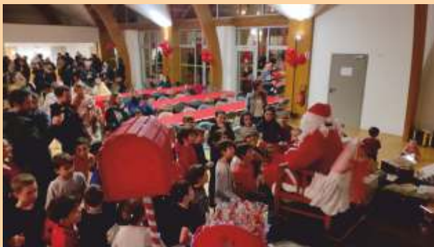
Soirée du père Noël

Nous remercions la municipalité de Mouazé pour son soutien et nous travaillons ensemble sur le projet de rénovation des anciens vestiaires pour permettre aux adhérents du club de revenir jouer sur le terrain municipal dans des conditions optimales.