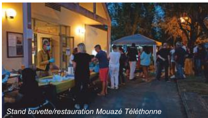
Stand buvette/restauration Mouazé Téléthonne