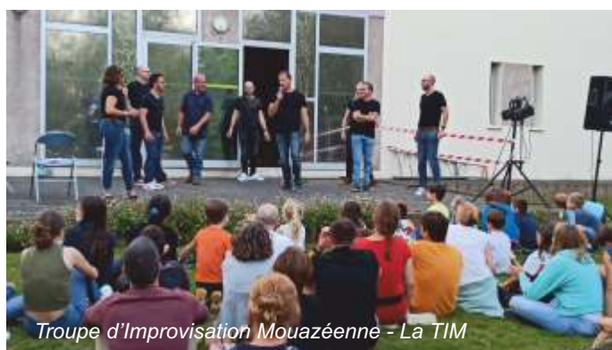
Troupe d'Improvisation Mouazéenne - La TIM

L'association Mouazé Téléthonne a également participé en proposant une buvette avec petite restauration sur place, au profit du Téléthon. Ces événements ont permis de montrer le lien qu'entretient la commune avec le tissu associatif. Une belle réussite !